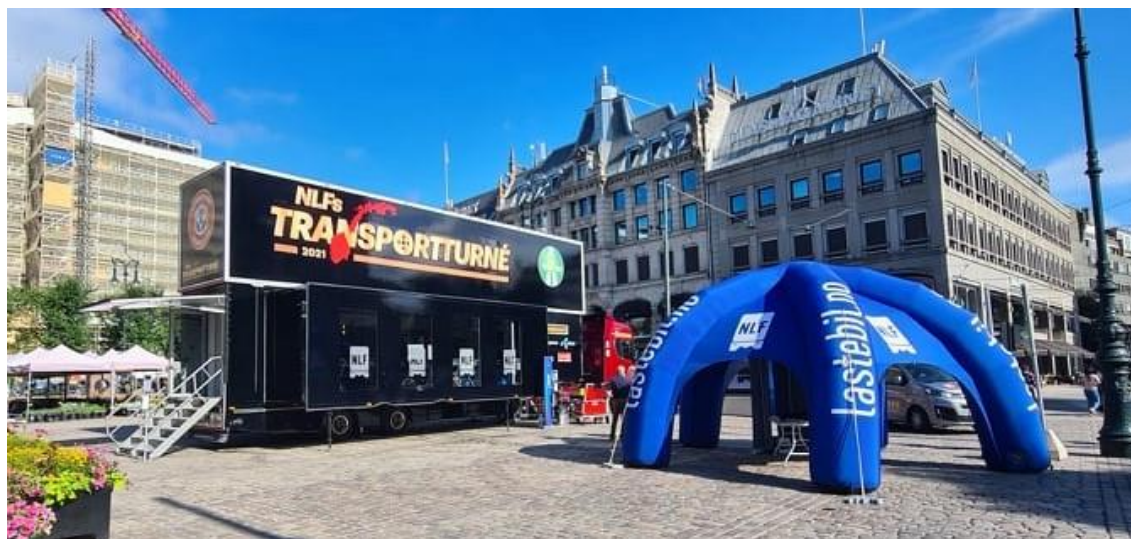
Stortorvet i Oslo

NLF sin transportturne ble åpnet på Stortorvet i Oslo 9. august. Nå har NLF organisasjonen fullt fokus på å ta imot turneen rundt omkring i hele landet.