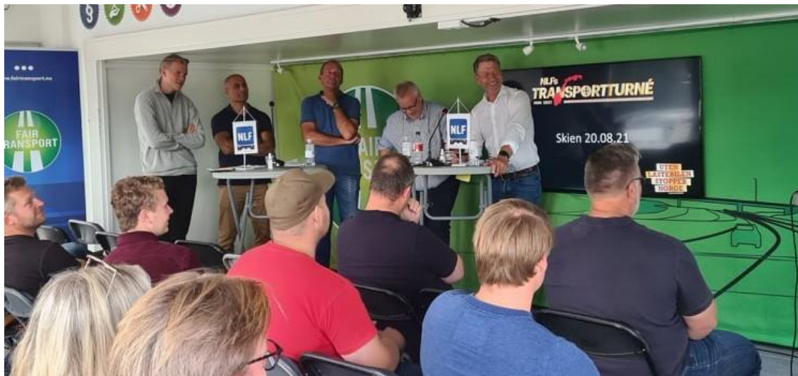
Representantene fra stortingspartiene i Telemark valgdistrikt i aksjon.