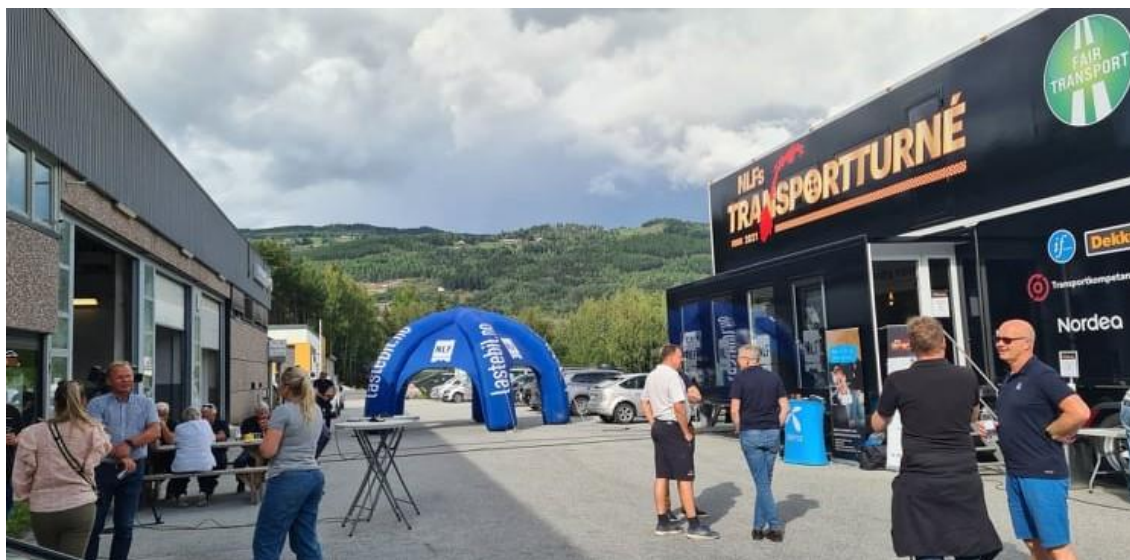
Første stopp for transportturneen i bygde Norge var hos Dekkmann Gol

De fleste av de lokale medlemsbedriftene til NLF i Hallingdal var innom når transportturneen hadde sin første stopp hos Dekkmann på Gol onsdag 11. august.