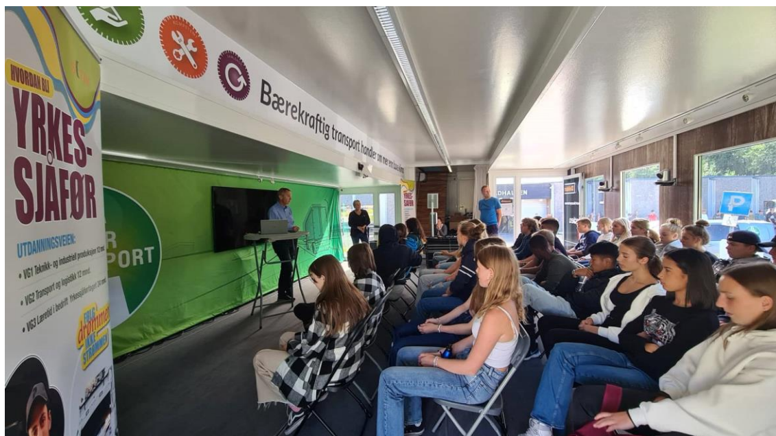
Elevene får informasjon om muligheten for arbeid i transportnæringen

Lenke til korte filmsnutter på Facebook: